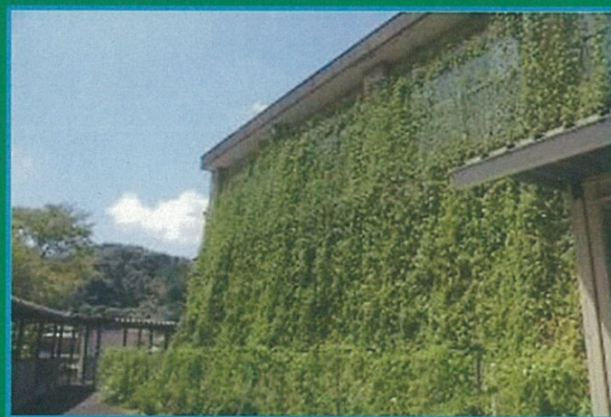
<昨年度 最優秀賞> 中津市立山移小学校(中津市)