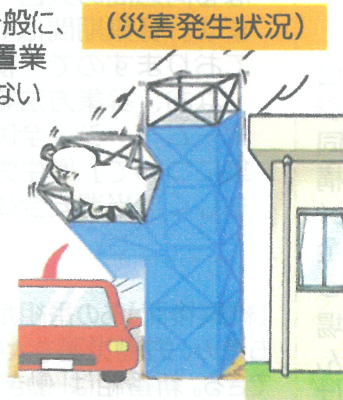
（イラストはイメージで、実際の災害発生状況とは異なる。）

仮設物（足場）の倒壊は一つ間違えば大きな災害につながりかねないだけに、当署では、足場部材を使用して飛散防止用の仮設物を設置する事業者に対して、倒壊防止対策を講じるよう呼びかけるとともに、パトロール指導を強化して再発防止に努めてまいります。