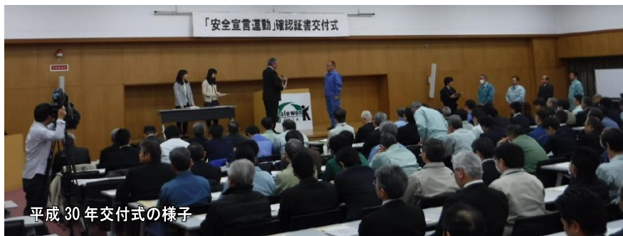
平成 30 年交付式の様子

(有)相川工業所 愛幸建設工業(有) (株)秋田建設工業 麻田建設(有) 朝日工業(株)大分事業所 旭興産(株) アスク・サンシンエンジニアリング(株)大分営業所 アズビル(株)アドバンスオートメーションカンパニー大分営業所 麻生商事(有) A N A I (株) (株)安部組 (株)安東建設 (有)一心工業 (株)今吉機設 (有)岩尾商事 上田重建(有) (有)上野工事 内海板金工業(株) ウメサン(株)昭電事業所 ウメサン(株)新日鐵住金事業所 梅林建設(株) (株)A K 企画 (株)E V O MK プランテック(株)佐賀関営業所 (有)大分ガス圧接工業 (株)大分電設 (株)大川技研 (有)岡ゴム商会 岡本工業(有) 鬼塚電気工事(株) 鬼塚産業(株) (有)開成工業 (有)カイダ電設 角栄建設工業(株) 鹿島・竹中土木・三井住友特定建設工事共同企業体大分川ダム建設工事事務所 (株)カシワバラ・コーポレーション大分石油化学コンビナート作業所 (株)上組三井 E & S マシナリー事業部 (有)加茂電子工業 河野電気(株) 河野電気(株)佐賀関事業所 (株)杵築建設 (株)木戸硝子 (有)久工機電 九鉄工業(株)大分支店 (株)九電工大分営業所 (株)九電工大分支店 (株)九電工佐賀関事務所 久和電気工事(有) (有)共成工業 協和工業(株) (株)協和商会 極東興和(株)西大内陸橋作業所 清末塗装(株) 清本鐵工(株)大分事業部 (株)熊野建設 (株)グランディーズ (有)桑野建設 (有)桑原工業 (有)幸野建設 (有)甲原組 弘洋工業(株) (有)広和工業 (有)五大計装 (株)後藤組 後藤建設(株) 後藤建設(株)末広南春日線作業所 五洋建設(株)大分営業所 (株)佐伯建設 (株)SAKAE 佐藤建設(株) 佐藤土木(株) 山九(株) 山九(株)大分東支店 山九大分ビジネス(株)