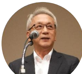
主催者挨拶をする生野署長