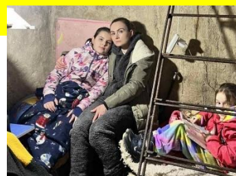
来県されたご家族の地下室での避難生活

大分県の人口10万人あたりの留学生数は全国3位であり、ウクライナを含め、海外から多くの留学生を受け入れてきました。また、昨年のオリンピック・パラリンピック事前キャンプでは、ウクライナを含む7カ国のアスリートが県内各地で地域住民との交流を図りました。このような大分県とウクライナとの関係が契機となり、4月10日には日田市に、また4月中旬には別府市に避難民が到着し、県内で避難生活を送ることとなりました。