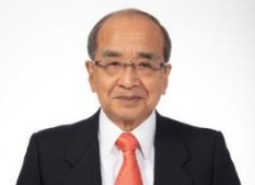
(大分県知事 広瀬 勝貞)

避難民の皆様の支援にあたっては、住居の提供や生活支援、就学・就労、日本語教育など、受入先の市町村や支援団体等と連携しながら、避難民の方々に大分県で安心して生活いただけるよう、しっかりサポートを行ってまいります。