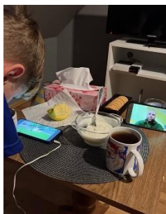
来県されたご家族のポーランドでの避難生活

避難民として大分県へいらっしゃる皆さんにはありとあらゆる支援が必要となります。毎日の生活に必要な物資等はもちろん、例えば、ウクライナから大分県へ避難される皆様は、初めて日本を訪れる方がほとんどで、日本語でのコミュニケーションをとることはできません。