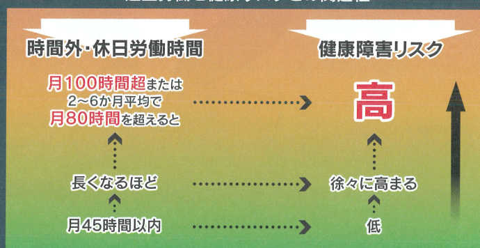
過重労働と健康リスクとの関連性

(右の図は、労災補償に係る脳・心臓疾患の労災認定基準の考え方の基礎となった医学的検討結果を踏まえたものです。)