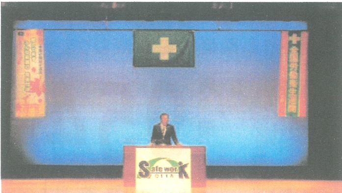
【主催者を代表して挨拶する大分労働基準監督署長】